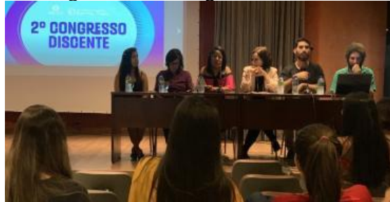
Figura 14: II Congresso Discente

Trabalho - GT. Importante destacar a heterogeneidade no perfil dos pesquisadores de cada GT, os mesmos pertenciam a áreas diversas, entretanto, suas pesquisas dialogavam nas temáticas. O objetivo desta dinâmica foi envolver estudantes e professores em um amplo debate sobre as temáticas do seu campo disciplinar, assim como propiciar contato com pesquisas de outras áreas que dialogassem entre si.