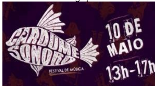
Figuras 21: Cartaz de divulgação - Cardume Sonoro.