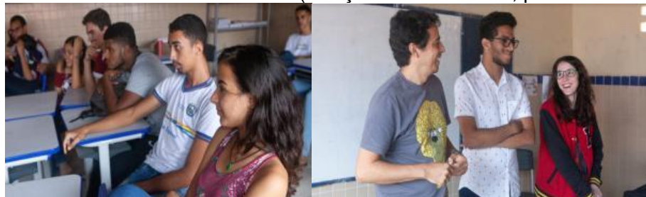
Figuras 16 e 17: Ventura na Escola (exibição do filme Amor, plástico e barulho)