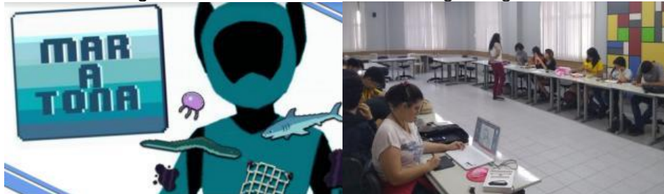
Figuras 24 e 25: IV Maratona de Jogos Digitais.