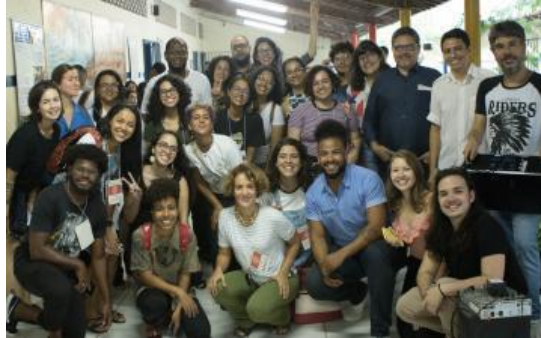
Figura 7: Discentes, docentes, coordenadores e funcionários da FIBAM na Escola Costa Azevedo - Dia da Responsabilidade Social.

acadêmica: docentes, discentes, corpo técnico-administrativo e coordenadores dos cursos.