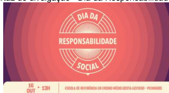
Figura 6: Cartaz de divulgação - Dia da Responsabilidade Social 2019.

Dia da Responsabilidade Social - Uma das MISSÕES das Faculdades Integradas Barros Melo é contribuir na formação de profissionais e cidadãos tecnicamente capazes e socialmente comprometidos com o bem comum. As práticas de Responsabilidade Social permeiam o dia a dia da FIBAM com ações junto à comunidade local. Desde 2015, a IES realiza o Dia da Responsabilidade Social com o objetivo de reunir a comunidade acadêmica e os moradores da localidade. A proposta é democratizar o conhecimento com atividades informativas e formativas.