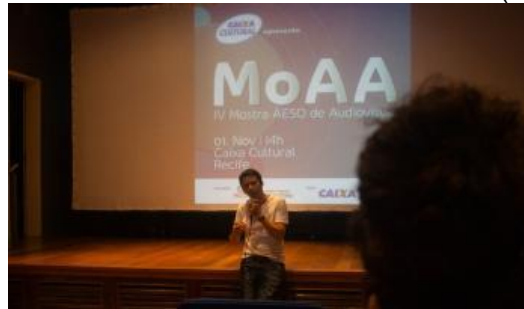
Figura 15: 4ª Mostra AESO de Audiovisual (MoAA).