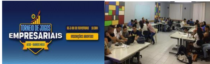
Figuras 22 e 23: I Torneio de Jogos Empresariais.

da visão sistêmica, de análise e acompanhamento de resultados em empresas.