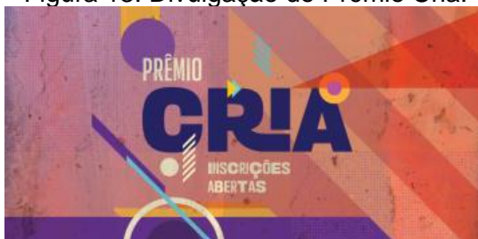
Figura 13: Divulgação do Prêmio Cria.