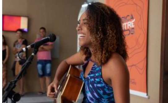
Figuras 18: Apresentação de discente em 2019.

se restringe apenas à formação profissionalizante, mas também se firma em uma proposição artístico e cultural.