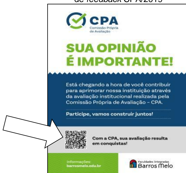
Figura 1: Cartaz utilizado na Campanha de Sensibilização e de feedback CPA/2019

A Comissão Própria de Autoavaliação, com o intuito de fomentar a cultura da autoavaliação institucional, realizou campanha em 2019 de sensibilização e de mobilização, articulando os diferentes segmentos envolvidos no processo da comunidade acadêmica das Faculdades Integradas Barros Melo – FIBAM: corpo docente, corpo discente, corpo técnico-administrativo e coordenadores. Cartazes foram utilizados, publicações nas redes sociais (Facebook e Instagram), assim como avisos por aplicativo de mensagens (WhatsApp), convidando a comunidade acadêmica a participar da autoavaliação. Nos cartazes foram disponibilizados QR Code remetendo diretamente à página da IES, garantindo o feedback mais rápido das conquistas da CPA em 2018, assim todos os seguimentos poderiam acessá-las através dos celulares/ smartphones.