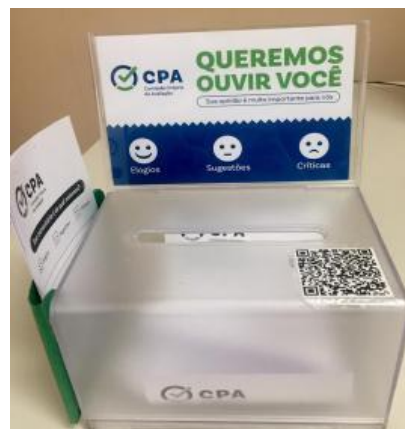
Figura 3: Caixa de sugestões e críticas.

Como proposta inovadora, a CPA adotou em 2019 um novo instrumento de coleta de dados complementar – as Caixas de Sugestões e Críticas . As caixas ficam disponíveis durante todo ano e estão colocadas em 5 (cinco) pontos da IES – recepção, secretaria, biblioteca, setor financeiro e restaurante. A comunidade acadêmica pode escrever suas sugestões ou críticas no formulário físico ou no formulário digital através de QR Code. O objetivo desse novo Instrumento é promover a maior participação de todos, no processo de melhoria constante da IES, possibilitando uma avaliação constante. A CPA, mensalmente, faz um levantamento das demandas que são apontadas e encaminha aos setores responsáveis. Posteriormente, cada setor informa para CPA as ações que estão sendo providenciadas.