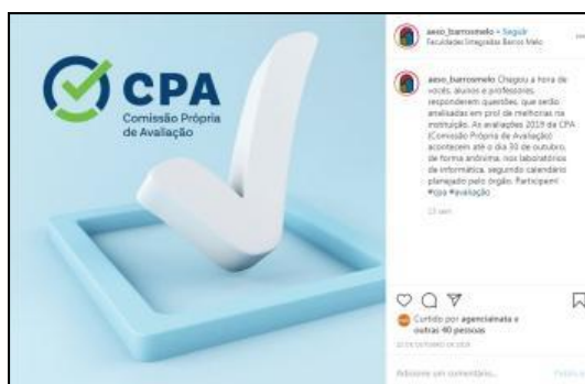
Figura 2: Publicação nas redes sociais utilizada para mobilização.