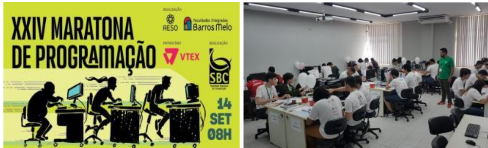
Figuras 19 e 20: XXIV Maratona de Programação - FIBAM