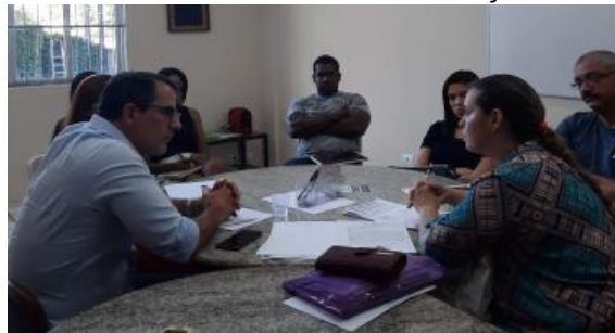
Figura 5: Câmara Privada de Conciliação e Mediação.

Câmara Privada de Conciliação e Mediação e Arbitragem da FIBAM/AESO - A Câmara é um espaço que capacita os estudantes para a solução judicial e extrajudicial de conflitos, implantada através do convênio: nº. 009/2016 com o TRIBUNAL DE JUSTIÇA DO ESTADO DE PERNAMBUCO. A Câmara Privada de Conciliação e Mediação das FIBAM/AESO, participou de mutirões na Paróquia Nossa Senhora da Ajuda em maio de 2019, e, no segundo semestre, do Dia da Responsabilidade Social, realizado em outubro de 2019, na sede da Escola de Referência em Ensino Médio Costa Azevedo, localizada no bairro Peixinhos, Olinda, e, da Semana Nacional de Conciliação em novembro de 2019, ocorrido no Hall Monumental do Fórum Rodolfo Aureliano de Recife.