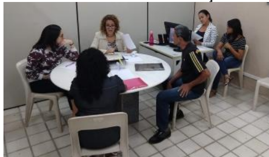
Figura 4: Câmara Privada de Conciliação e Mediação.

Núcleo de Prática Jurídica – NPJ - A Prática Jurídica das Faculdades Integradas Barros Melo é atualmente oferecida nas modalidades de práticas reais e simuladas aos alunos do Curso de Graduação em Direito no Núcleo de Prática Jurídica através das disciplinas Prática I, (Prática de Processo Civil), Prática II (Prática do Processo Trabalhista), Prática III, (Prática do Processo Penal) e, por fim, Prática IV, (Mediação Judicial). Integra ainda o ensino da prática jurídica no NPJ a assistência jurídica gratuita que a IES presta à pessoas carentes, residentes nas comunidades situadas no entorno da Instituição, atendimento esse, realizado sob a supervisão dos Professores-Orientadores, ação que reforça os princípios da instituição, enquanto formadora de profissionais com responsabilidade social.