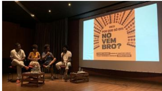
Figura 12: Por que só em Novembro?

Novembro é o mês da consciência negra e, diante disso, em 2019 as Faculdades Integradas Barros Melo promoveram o evento “ Por que só em Novembro? ” para discutir assuntos de interesse da população afrodescendente. A atividade interdisciplinar teve início com uma mesa, realizada por alunos e egressos da FIBAM. A segunda parte do encontro contou com uma exposição de trabalhos artísticos realizados pelos alunos.