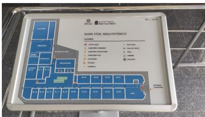
Figura 27: Mapa Tátil

A FIBAM contempla acessibilidade, possuindo nas áreas de maior circulação que possibilitam o acesso a todos da comunidade acadêmica. Em 2019, deu início a implantação do projeto Rota Acessível que prevê a instalação do piso tátil em toda a sua unidade.